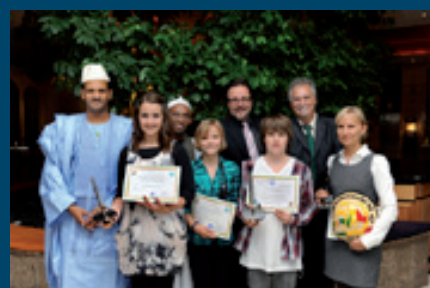
Die Gewinner des Schülerwettbewerbes zur Preisverleihung in Berlin