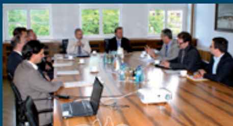
Bei der Landesdirektion