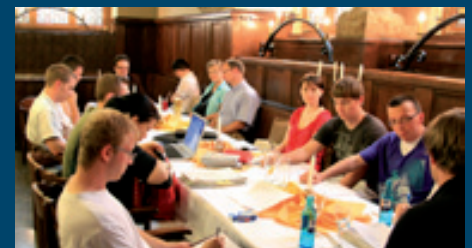
Im Ratskeller mit der Jungen Union