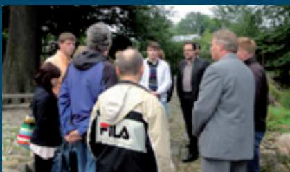
Im Botanischen Garten

Ich habe in den Sommermonaten viele Unternehmen besucht, unsere wirtschaftliche Struktur analysiert und die Probleme der Arbeitgeber kennengelernt. Ein Besuch des Technologie Centrum Chemnitz (TCC) hat mich besonders beeindruckt. Unterschiedliche Studien haben gezeigt, dass wir in den neuen Bundesländern im Vergleich zu den alten Ländern insgesamt besser durch die Finanz- und Konjunkturkrise gekommen sind. Die entsprechend optimistische Stimmung begegnete mir in den meisten meiner Begegnungen mit Chemnitzer Unternehmern in den letzten Wochen.